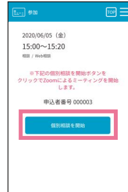
スワイプ後の画面