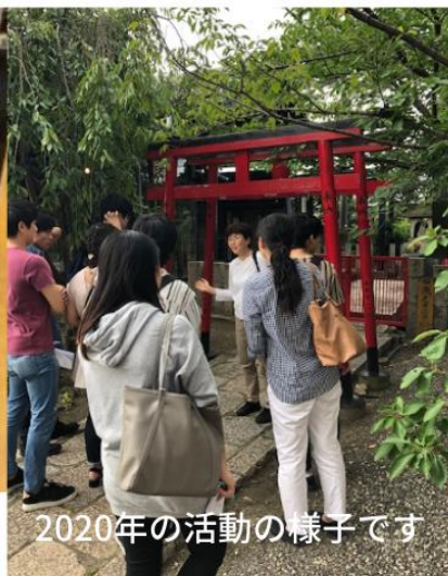
2020年の活動の様子です