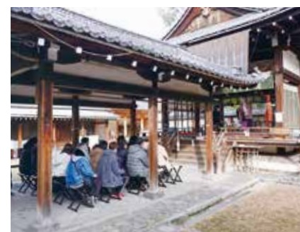
地域ブランド研究 地域・地方の魅力を生かした新たなブランドづくりと地域活性化、また、観光と集客について現場で学ぶ実践型の講義です。