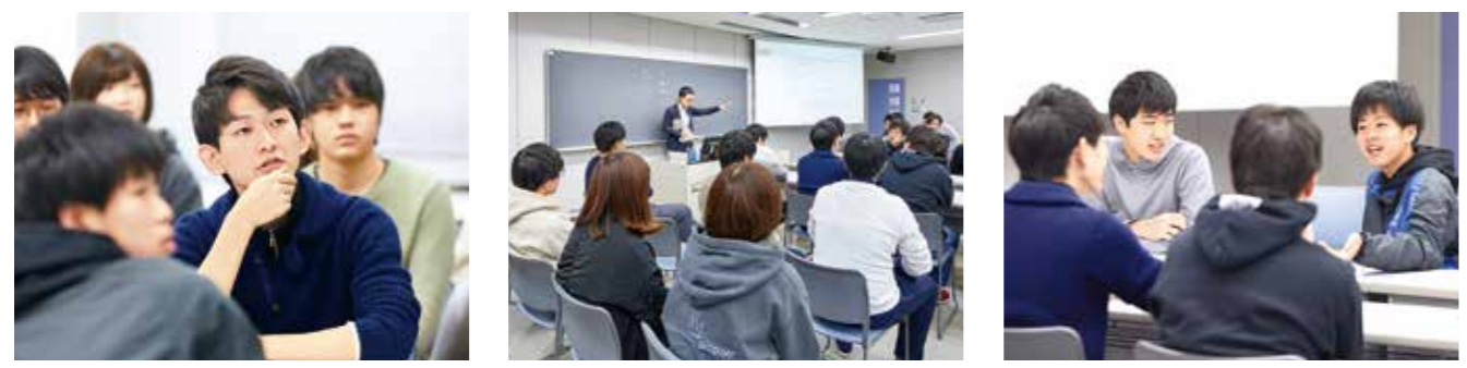
公務員特別演習 さまざまなテーマについて話し合うグループディスカッションを実施。自分の話し方や考え方も客観視することで面接対策にも役立ちます。