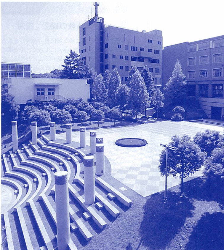
自然の光に満ちあふれ、落ち着いた雰囲気の中に建つ学舎