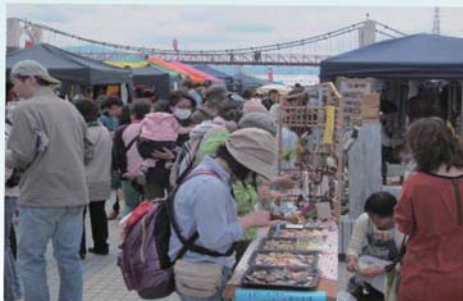
◀ クローバー手作り市の様子