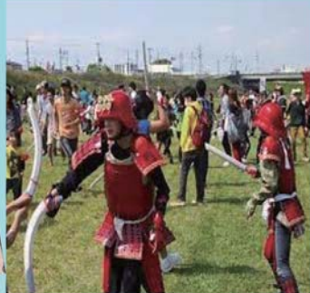
▲チャンバラ合戦の激闘の様子