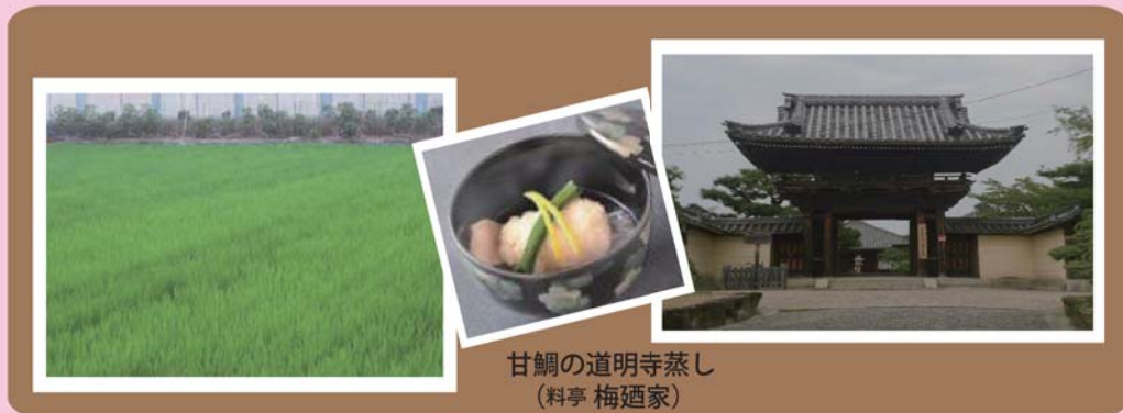
甘鯛の道明寺蒸し (料亭 梅迺家)

道明寺粉は、お菓子作りだけでなく料理にも使えます。小魚やエビ、野菜などにまぶして、揚げた“道明寺揚げ”や、蒸した“道明寺蒸し”などがあります。道明寺揚げは、おつまみにしてもサイコーです！