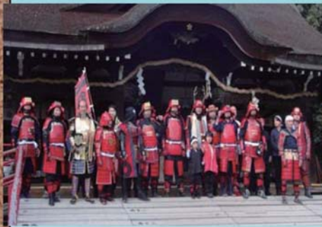
▼古戦場巡りの 情緒あふれる碑石